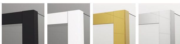
06 BLACK-Line 09 WHITE-Line 12 GOLD-LINE 50 Silber-Hochglanz